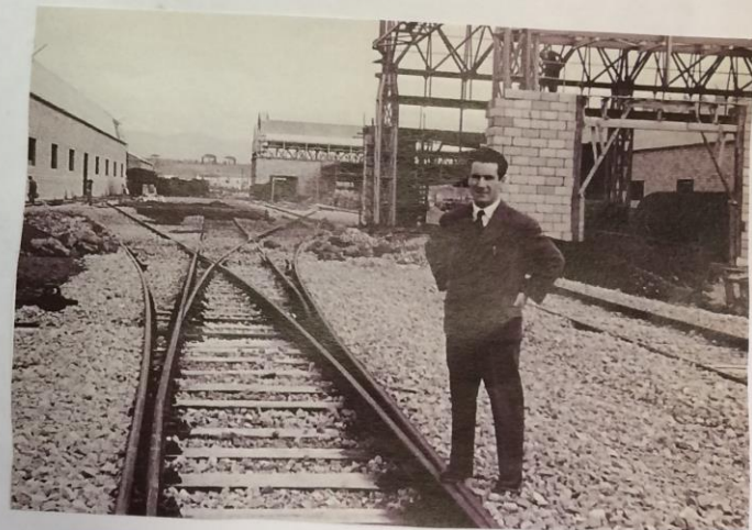
Sul luogo di lavoro, stabilimento di Porto Velino