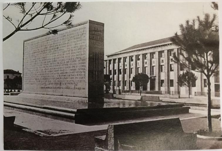
L'attesa "P22 caduti 6 luglio" con l'Associazione diseredati Nemoloni, 1939